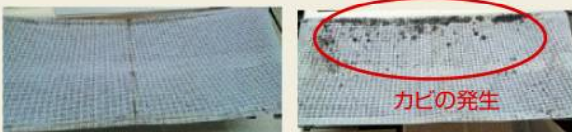
左はじょきん娘使用、右は使用しない。