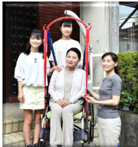
つるべーGシリーズ