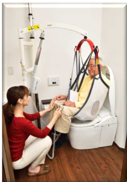
つるべーFシリーズ