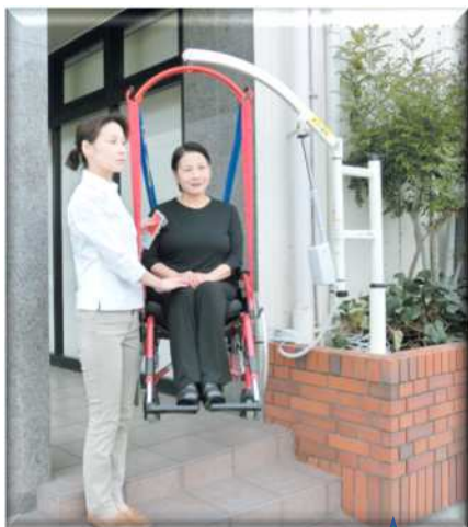
つるべーUシリーズ