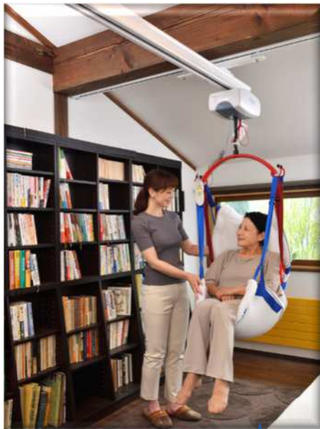
つるべーTENシリーズ