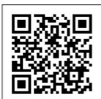
SSシリーズ事例動画

*設置場所によっては消防法によりスプリンクラーの移設工事が必要になる場合もございます。